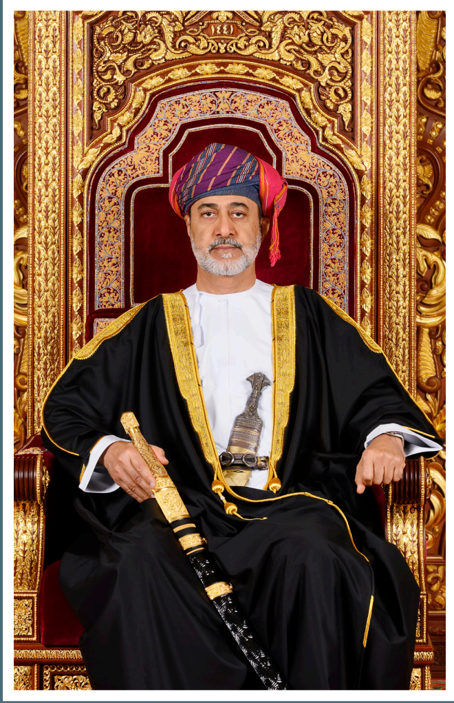
حضرة صاحب الجلالة السلطان هيثم بن طارق المعظم -حفظه الله ورعاه-