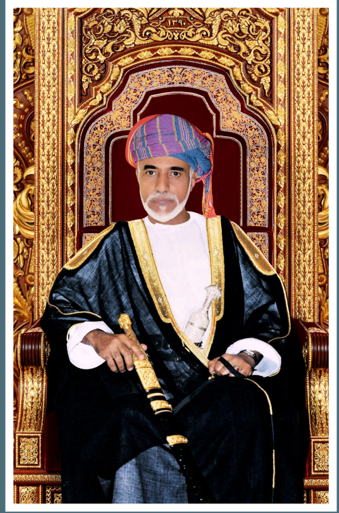
المغفور له بإذن الله السلطان قابوس بن سعيد -طيب الله ثراه-